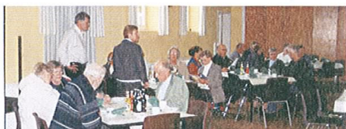
1. Borgermøde i Klim Forsamlingshus 29. april 2003. Borgerforeningen stod for arrangementet; over 50 borgere deltog. Annonceringen var sponsoreret af Klim Sparekasse. Borgmester og flere lokalpolitikere deltog aktivt i mødet.