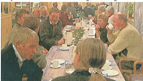
3. Borgermøde i Øster Assels 28. oktober 2003. Ved kaffebordet diskuterede man bl.a. ønsket om at ombygge eller erstatte 8 eksisterende ældreboliger med nye seniorboliger.