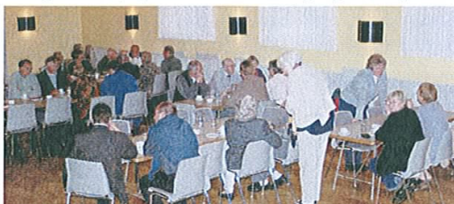
2. Borgermøde i Sorring Forsamlingshus 14. maj 2003. Her blev nedsat 3 arbejdsgrupper, som de næste par måneder arbejdede med ønsker til seniorboliger i Sorring.