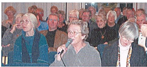
Der var stor spørgelyst ved høringen om seniorbofællesskaber, hvor de fem oplægsholdere bagefter deltog i panelet. Forholdet mellem de høje priser på nybyggeri og pensionisternes økonomi var blandt de emner der gik igen i spørgsmålene.