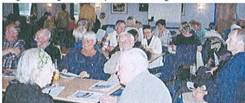
1. Borgermøde i Tisvilde Idrætshus 6. maj 2003. Små 100 mennesker mødte op til lokalrådets arrangement. Det største deltagerantal i projektet. Derimod deltog ingen lokalpolitikere.